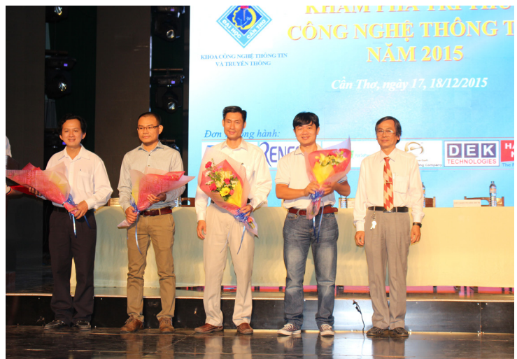
Trao hoa cho các nhà tài trợ.