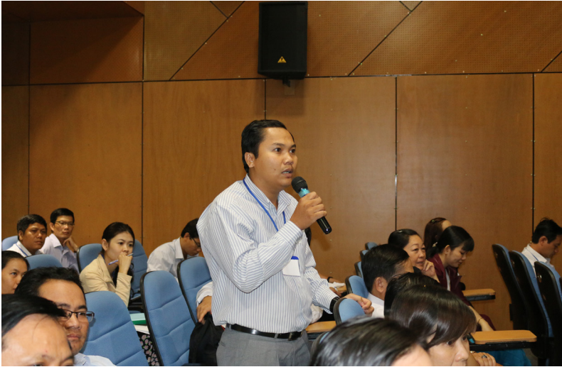
Đại biểu sôi nổi thảo luận tại Hội thảo.

Quyết định số 1400/QĐ-TTg ban hành ngày 30/9/2008 của Thủ tướng Chính phủ, đã chỉ rõ mục tiêu đổi mới toàn diện việc dạy và học ngoại ngữ trong hệ thống giáo dục quốc dân, triển khai chương trình dạy và học ngoại ngữ mới ở các cấp, trình độ đào tạo; đến năm 2020 đa số thanh niên Việt Nam tốt nghiệp trung cấp, cao đẳng và đại học có đủ năng lực ngoại ngữ sử dụng độc lập, tự tin trong giao tiếp, học tập, làm việc trong môi trường hội nhập, đa ngôn ngữ, đa văn hóa; biến ngoại ngữ trở thành thế mạnh của người dân Việt Nam, phục vụ sự nghiệp công nghiệp hóa, hiện đại hóa đất nước.