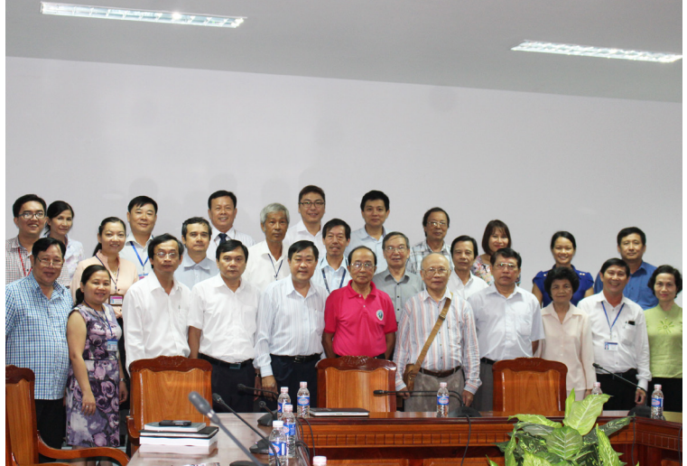
Ảnh lưu niệm tại buổi làm việc với Hội đồng CDGSNN ngành Sinh học. công tác thực tế tại Trường.

Chia sẻ tại buổi làm việc, GS.TSKH. Vũ Quang Côn cho biết, Hội đồng rất ủng hộ các ứng viên của ngành Sinh học và đề nghị các ứng viên nên nghiên cứu thật kỹ và thực hiện đúng theo văn bản Pháp quy. Đồng thời, những đề xuất từ phía Nhà trường nên thông qua văn bản để Hội đồng dễ dàng tiếp cận và xem xét. Hội đồng cũng đánh giá cao năng lực của các ứng viên từ Trường ĐHCT sau những chuyến