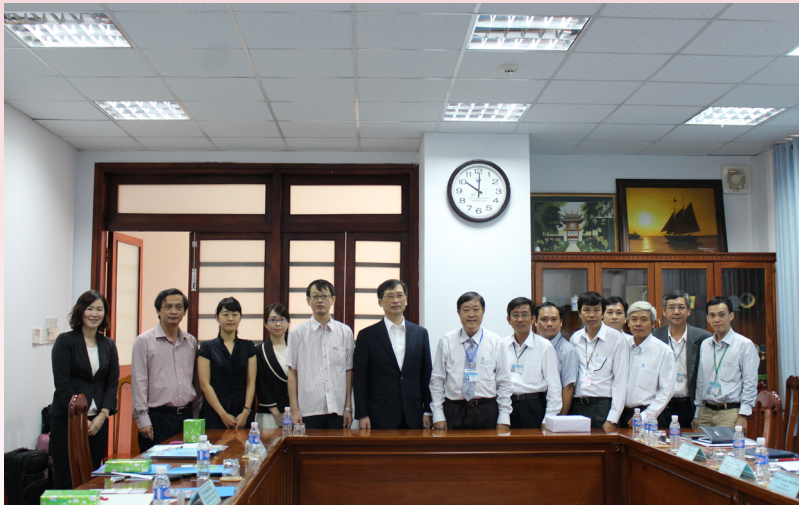
Đoàn Đại học TUMSAT và Trường ĐHCT trao quà và chụp ảnh lưu niệm.

Huyền Trang Đài, Lớp Biên dịch-Phiên dịch Khóa 38