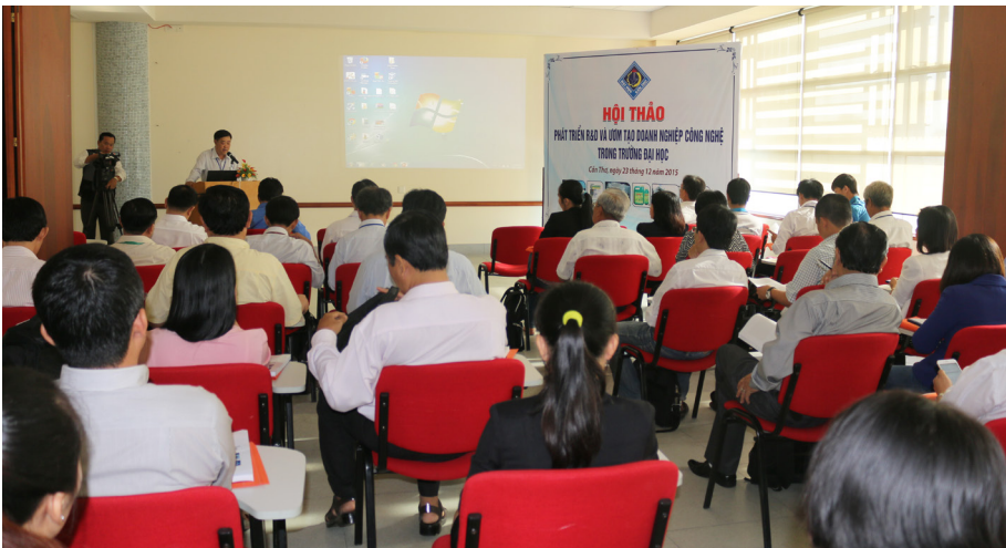
Toàn cảnh Hội thảo “Phát triển R&D và ươm tạo doanh nghiệp công nghệ trong trường đại học”.

Ngày 23/12/2015, tại Trung tâm Học liệu-Trường Đại học Cần Thơ (ĐHCT), Trung tâm Ươm tạo Doanh nghiệp Công nghệ phối hợp với Trung tâm Dịch vụ và Chuyển giao Công nghệ-Trường ĐHCT tổ chức Hội thảo “Phát triển R&D và ươm tạo doanh nghiệp công nghệ trong trường đại học” nhằm định hướng R&D (nghiên cứu và phát triển) và ươm tạo doanh nghiệp công nghệ cũng như nâng cao khả năng thương mại hóa sản phẩm khoa học công nghệ của Trường ĐHCT; đồng thời tạo diễn đàn cho nhà quản lý, nhà nghiên cứu khoa học và các doanh nghiệp công nghệ có cơ hội trao đổi, phân tích tiềm năng, triển vọng và đề xuất giải pháp hợp tác nghiên cứu và chuyển giao công nghệ tại Đồng bằng sông Cửu Long (ĐBSCL).