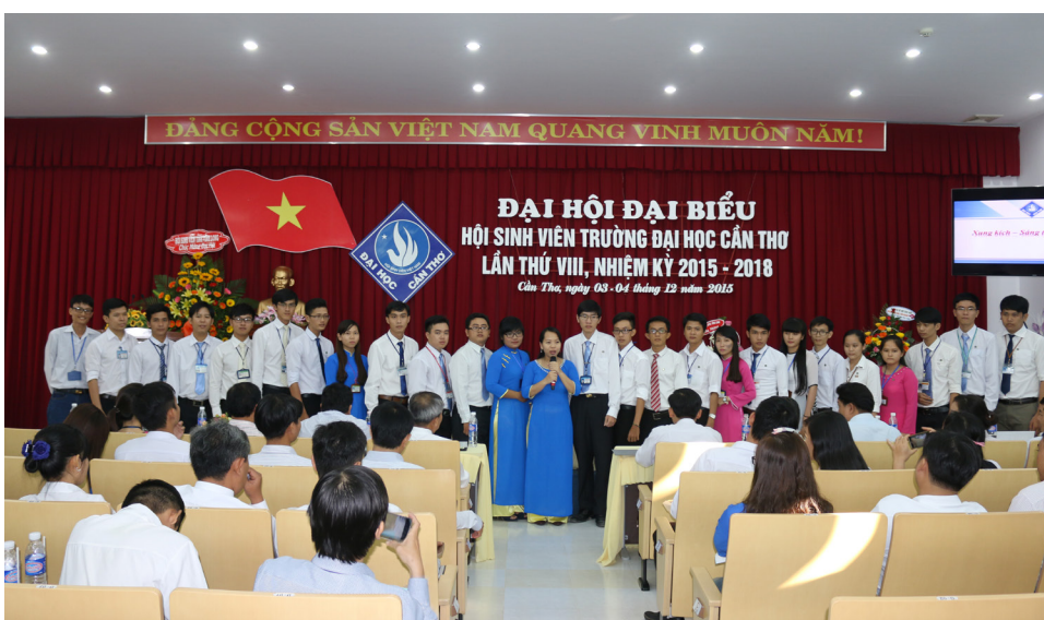
Ban Chấp hành Hội Sinh viên Trường ĐHCT khóa mới ra mắt Đại hội.

Qua hai ngày làm việc sôi nổi, tích cực, Đại hội đã kết thúc thành công tốt đẹp. Với sự đồng thuận của tất cả đại biểu tham dự, Hội Sinh viên Trường ĐHCT tin tưởng sẽ hoàn thành mục tiêu xây dựng Hội Sinh viên Việt Nam ngày càng vững mạnh, phát huy tiềm năng của sinh viên xung kích, sáng tạo, chung sức với cộng đồng đáp ứng yêu cầu của sự nghiệp công nghiệp hóa, hiện đại hóa đất nước.