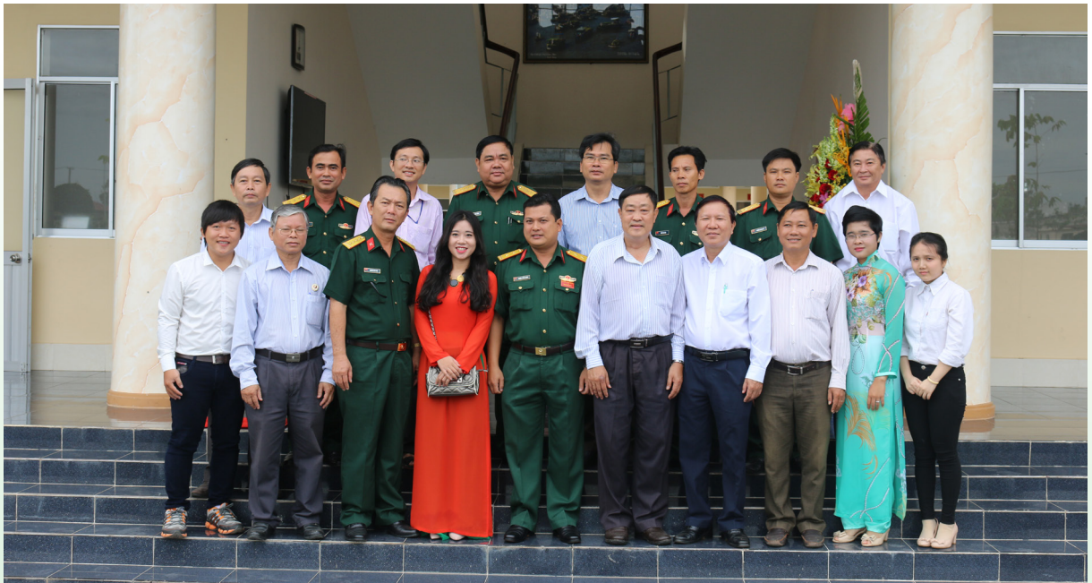
Ảnh lưu niệm tại buổi thăm và chúc mừng Bộ Tư lệnh Quân khu 9.