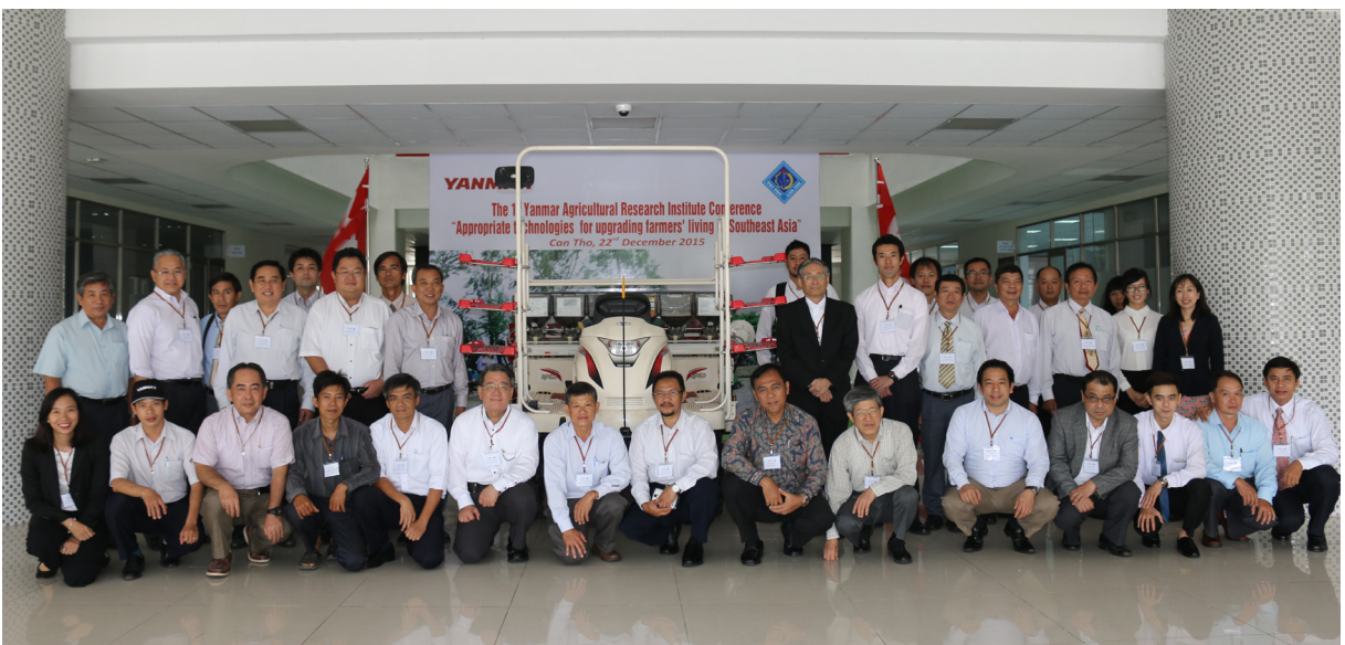
Đại biểu chụp ảnh lưu niệm.

Qua một ngày làm việc tích cực, Hội nghị đã đạt được mục tiêu đề ra là tổng kết, đánh giá và định hướng hoạt động nghiên cứu sắp tới của YARI. Bên cạnh đó, đây là dịp để các viện, trường, doanh nghiệp và địa phương học hỏi kinh nghiệm, tìm hiểu nhu cầu thực tế và tăng cường kết hợp đào tạo, nghiên cứu khoa học, giải quyết các vấn đề áp dụng khoa học kỹ thuật trong cơ giới hóa sản xuất nông nghiệp, góp phần phát triển nền nông nghiệp bền vững cho vùng ĐBSCL.