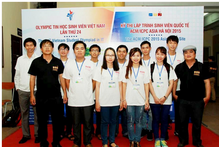
Đội tuyển Trường Đại học Cần Thơ tham dự kỳ thi Olympic Tin học Sinh viên Việt Nam lần thứ 24 và Kỳ thi Lập trình sinh viên Quốc tế ACM/ICPC năm 2015.

Kỳ thi Olympic Tin học sinh viên toàn quốc được khởi xướng từ năm 1992, nhằm khơi dậy niềm đam mê nghiên cứu, sáng tạo trong lĩnh vực Công nghệ thông tin (CNTT) của sinh viên các trường đại học, cao đẳng trên toàn quốc. Trải qua 23 lần tổ chức, nó đã trở thành ngày hội của sinh viên yêu thích Công nghệ Thông tin và Truyền thông (CNTT&TT). Cũng chính qua các cuộc thi này, nhiều nhân tài trong lĩnh vực CNTT đã được phát hiện, bồi dưỡng và trưởng thành. Olympic Tin học gồm các khối thi kỹ năng cá nhân bao gồm: Siêu CUP OLP, Chuyên Tin, không Chuyên Tin, Cao đẳng và Phần mềm nguồn mở.