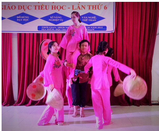
Tiết mục biểu diễn văn nghệ, ca múa hát.

Điểm mới ở Hội thi năm nay là có sự tham gia giao lưu của sinh viên đến từ hai ngành Sư phạm Ngữ văn và Sư phạm Toán. Điều này giúp cho sinh viên tiểu học có thêm cơ hội để mở rộng tầm nhìn, học hỏi và trau dồi thêm các kiến thức và các kỹ năng mềm. Ngoài ra, các tiết mục văn nghệ biểu diễn trong đêm chung kết