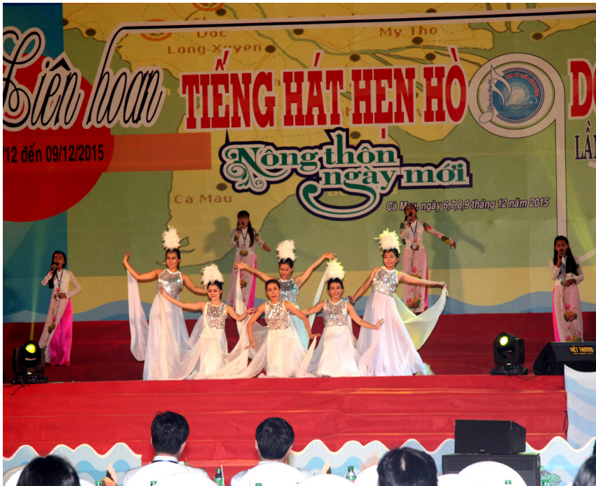
“Giấc mơ cánh cò” - Tiết mục đạt Huy chương Vàng tại Liên hoan.

múa “ Những bông hoa trên miền quê mới ”. Ngoài ra, tối ngày 07/12/2015, Đoàn Nghệ thuật quần chúng của Trường cũng đã đi biểu diễn phục vụ nhân dân huyện Cái Nước, tạo được cảm tình với lãnh đạo và nhân dân địa phương. Đoàn cũng nhận được Bằng khen của Ủy ban nhân dân tỉnh Cà Mau vì đã “ Tích cực tham gia Liên hoan Tiếng hát hẹn hò 9 dòng sông lần thứ XV - Cà Mau năm 2015 ”. Được biết, Liên hoan Tiếng hát hẹn hò 9 dòng sông lần thứ XVI - năm 2017 sẽ do tỉnh An Giang đăng cai tổ chức.