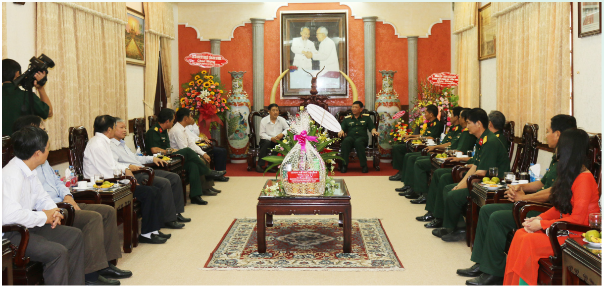
Thăm và chúc mừng Bộ Tư lệnh Quân khu 9.

Ngày 21/12/2015, nhân dịp Kỷ niệm 71 năm thành lập Quân đội Nhân dân Việt Nam (22/12/1944-22/12/2015), Trường Đại học Cần Thơ (ĐHCT) đã tổ chức đoàn công tác đến thăm, chúc mừng và giao lưu với các đơn vị lực lượng vũ trang nhân dân đóng quân trên địa bàn thành phố Cần Thơ, gồm: Bộ Tư lệnh Quân khu 9, Cục Chính trị Quân khu 9 và Bộ Chỉ huy Quân sự thành phố Cần Thơ.