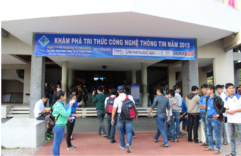
Khai mạc sự kiện Khám phá tri thức Công nghệ thông tin năm 2015 được diễn ra tại Hội trường Lớn-Trường ĐHTC.

Ngày 17/12/2015, Lễ khai mạc sự kiện Khám phá tri thức Công nghệ thông tin năm 2015 được diễn ra tại Hội trường Lớn-Trường Đại học Cần Thơ (ĐHCT). Tham dự buổi lễ có đại diện các doanh nghiệp, công ty tài trợ; cùng một số đại biểu là đại diện lãnh đạo các đơn vị trong Trường; giảng viên, sinh viên của Trường và các trường đại học, cao đẳng cùng tham gia.