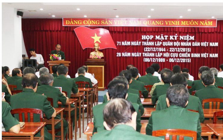
Buổi họp mặt Hội CCB Trường ĐHCT nhân ngày thành lập Quân đội Nhân dân Việt Nam và Hội CCB Việt Nam.

Ngày 22/12/2015, Hội Cựu Chiến binh (CCB)-Trường Đại học Cần Thơ (ĐHCT) đã tổ chức họp mặt kỷ niệm 71 năm ngày thành lập Quân đội Nhân dân Việt Nam (22/12/1944-22/12/2015) và kỷ niệm 26 năm ngày thành lập Hội CCB Việt Nam (06/12/1989-06/12/2015) nhằm ôn lại truyền thống lịch sử, đồng thời tổng kết hoạt động của Hội năm 2015.