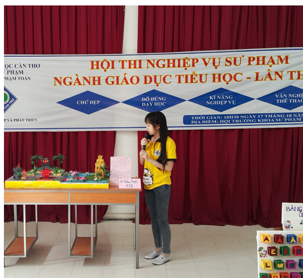
Sinh viên thuyết trình về đồ dùng dạy học.

Trong định hướng phát triển của ngành, Ban tổ chức Hội thi cũng mong muốn ngày càng có thêm nhiều cơ hội để sinh viên và cán bộ của ngành học tập, trau dồi chuyên môn với các trường bạn trong nước và quốc tế. Hội thi năm nay khép lại trong sự vui mừng, hào hứng lẫn tiếc nuối của tập thể sinh viên, hứa hẹn năm sau với nhiều nội dung hấp dẫn và đa dạng hơn.