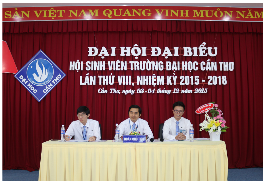
Đoàn Chủ tịch Đại hội Đại biểu Hội Sinh viên Trường ĐHCT lần thứ VIII, nhiệm kỳ 2015-2018.

T rong 02 ngày 03-04/12/2015, tại Nhà Điều hành-Trường Đại học Cần Thơ (ĐHCT) đã diễn ra Đại hội Đại biểu Hội Sinh viên-Trường ĐHCT lần thứ VIII, nhiệm kỳ 2015-2018. Đến dự Đại hội có đại diện Thường trực Ban Thư ký Hội Sinh viên Việt Nam thành phố Cần Thơ; đại diện Ban Thường vụ Đảng ủy-Ban Giám hiệu cùng lãnh đạo các khoa, phòng ban, đoàn thể trong Trường; các tổ chức Hội Sinh viên trong khu vực Đồng bằng sông Cửu Long và gần 180 đại biểu được triệu tập.