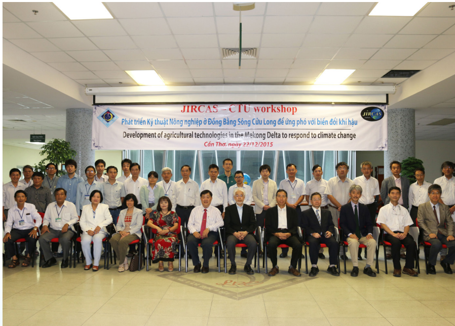
Hội thảo "Phát triển Kỹ thuật Nông nghiệp ở Đồng bằng sông Cửu Long để ứng phó với Biến đổi khí hậu" diễn ra tại Trung tâm Học liệu-Trường ĐHCT.

Ngày 22/12/2015, phối hợp với tổ chức JIRCAS (Trung tâm Nghiên cứu quốc tế Nhật Bản về Khoa học Nông nghiệp), Khoa Môi trường và Tài nguyên Thiên nhiên-Trường Đại học Cần Thơ (ĐHCT) đã tổ chức Hội thảo "Phát triển Kỹ thuật Nông nghiệp ở Đồng bằng sông Cửu Long để ứng phó với Biến đổi khí hậu" tại Trung tâm Học liệu-Trường ĐHCT.