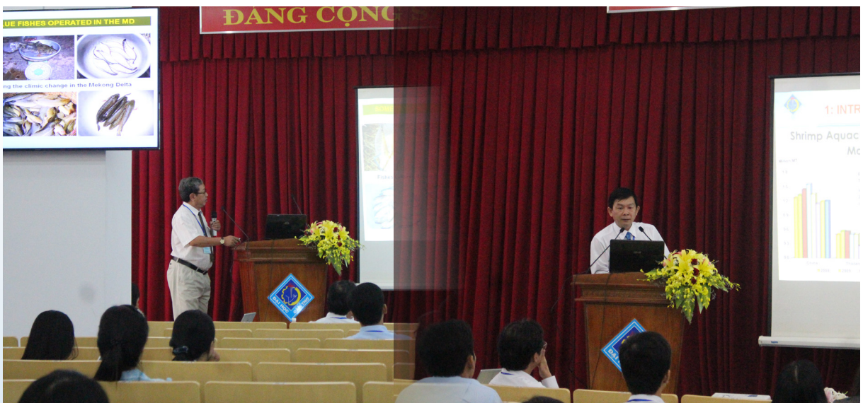
Các đại biểu báo cáo tham luận và chuyên đề tại Hội thảo.

Sau hai ngày diễn ra sôi nổi, Hội thảo đã kết thúc thành công tốt đẹp nhờ vào sự đóng góp và thảo luận tích cực của các đại biểu tham dự. Sau đó, các đại biểu đã có chuyến thăm trại nuôi tôm tập trung Việt Úc sử dụng mô hình nhà kính hiện đại tại tỉnh Bạc Liêu; các nhà máy chế biến tại Công ty chế biến Biển Đông ở Khu Công nghiệp Trà Nóc và Công ty chế biến Hiệp Thành tại Quận Thốt Nốt, thành phố Cần Thơ.