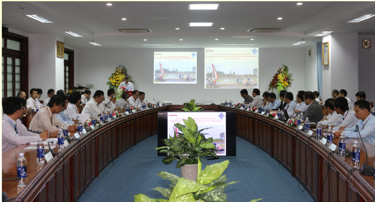
Hội nghị quốc tế “Công nghệ thích hợp nhằm nâng cao đời sống nông dân khu vực Đông Nam Á” diễn ra tại Nhà Điều hành-Trường ĐHCT.

Ngày 22/12/2015, Viện Nghiên cứu Nông nghiệp Yanmar Việt Nam (YARI-V) phối hợp với Trường Đại học Cần Thơ (ĐHCT) tổ chức Hội nghị quốc tế “Công nghệ thích hợp nhằm nâng cao đời sống nông dân khu vực Đông Nam Á” tại Nhà Điều hành-Trường ĐHCT.