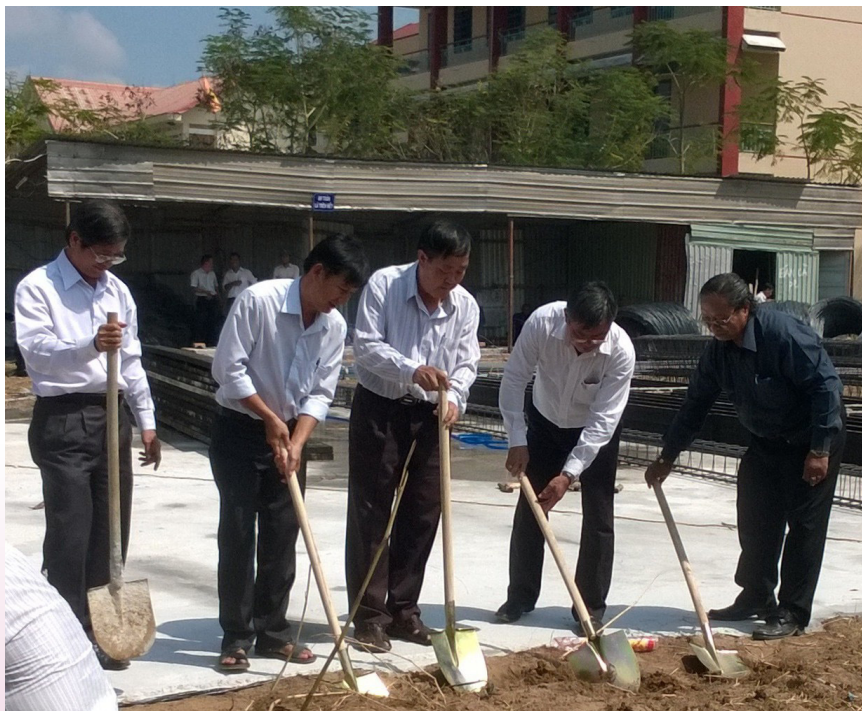
Các lãnh đạo làm Lễ Khởi công xây dựng Trung tâm Phát triển Kỹ năng Sư phạm.

Ngày 07/12/2015, Trường Đại học Cần Thơ (ĐHCT) đã tổ chức Lễ Khởi công xây dựng Trung tâm Phát triển Kỹ năng Sư phạm-Trường ĐHTC. Tham dự buổi lễ có đại diện lãnh đạo Nhà trường; đại diện lãnh đạo Khoa Sư phạm, Khoa Ngoại ngữ, các phòng, ban trong Trường và đơn vị thi công.